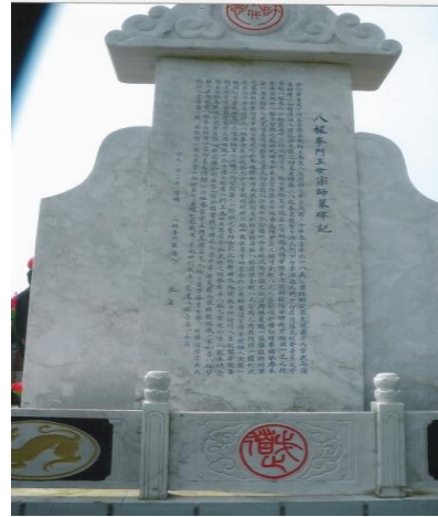
Visita a la tumba del Maestro Li Shu-Wen en el 2003. Mausoleo inaugurado en 2011.